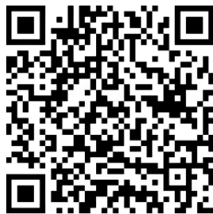
Catholic Welfare Services

BAIK - Sila teruskan untuk membantu 'Catholic Welfare Services' secara kewangan dalam pelayanan kita kepada golongan miskin dan yang memerlukan di dalam masyarakat kita tanpa mengira bangsa atau kepercayaan. Umat boleh membuat sumbangan melalui S Pay Global dengan mengimbas QR kod di sini. Sahkan bahawa penerima ialah 'Catholic Welfare Services' sebelum pemindahan dilakukan. Umat paroki juga boleh melakukan pemindahan dalam talian atau deposit tunai kepada akaun berikut: